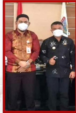
Wali Kota Palu