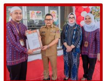
Bupati Kab. Banggai