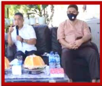
Wali Kota Palu