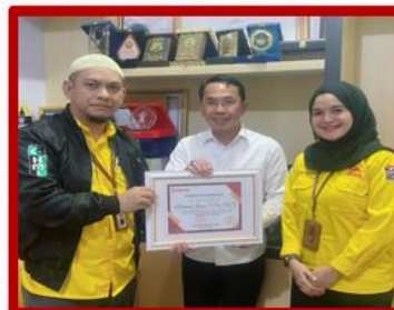
Bupati Kab. Sigi