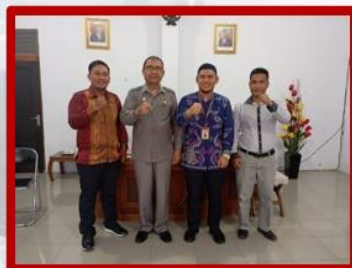
Sekab Kab. Poso